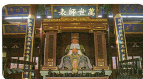
Temple of Confucius

图文独立表示图片与文本彼此之间互不影响, 是地位平等的关系。二者独立地表示意义, 但连接在一起构建图文的意义。图 2 是一个典型的图文独立的例子。图 2 中的单词和图片显示孔庙这一历史遗迹。文本模态以单词形式呈现孔庙的英文单词, 图像模态以图片的形式呈现孔庙的直观形象。在这一对图文组合中, 两种模态相互独立。学生如果不知道孔庙的英文单词, 也可以从图片中识别意义。