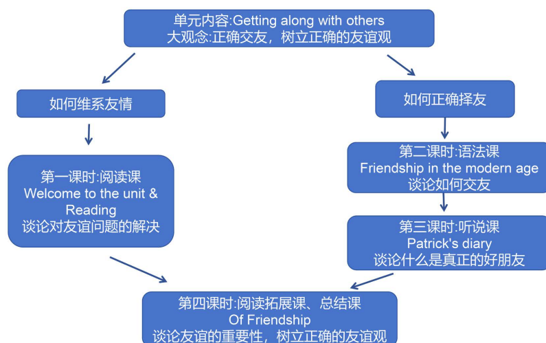
Figure 2. Teaching period plan

在实施阶段，本单元的课时可以按照阅读、语法、听说、拓展总结四个环节进行顺序安排，先把“友谊”的主线提炼出来，然后确定学生在听说读写中需要掌握和完成的重要内容，根据这些内容安排课堂活动，具体的课时安排如下图 2。