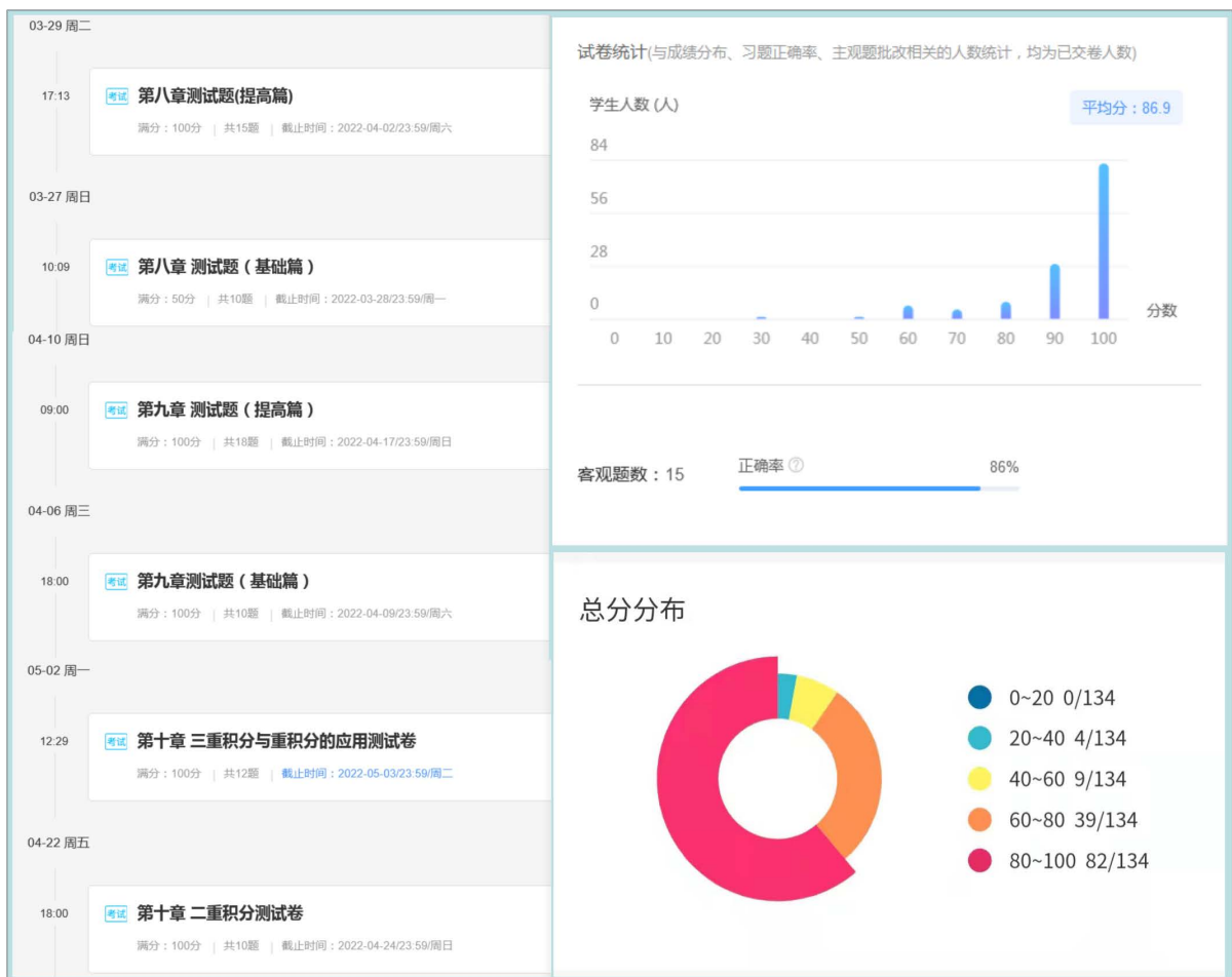
Figure 4. Test paper 图 4. 测试卷