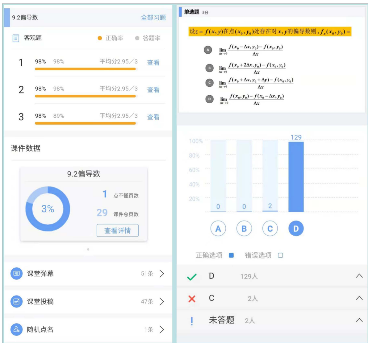
Figure 2. Class interaction-choice questions 图 2. 课堂互动 - 选择题

在整堂课中一直保持着紧张感和危机感，保持持续集中的学习状态。这种互动对于大容量班级的教学是非常有效的，可以及时、全面掌握学生的学习成效。