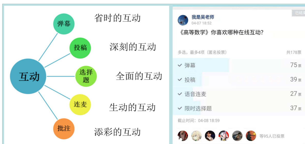
Figure 1. Class interaction

注重课堂互动,打造欢乐充实的课堂,并通过匿名投票调查学生对在线互动的认可程度如图1所示。仪式感是教学效果非常重要的影响因素之一,因此,我每次上课都保持人物出现在镜头前,给同学最真实、亲切的课堂体验。