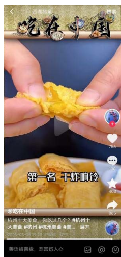
Figure 1. One of the top ten delicacies in Hangzhou