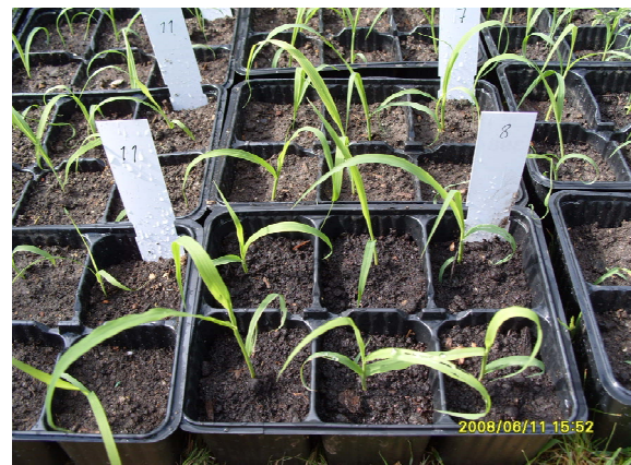
Figure 4. Miscanthus seedlings transplanted in trays 图 4. 芒属植物的种子苗分苗移栽于穴盘内

在北方地区(北纬 37^{\circ} 度以北), 对常温下保存 1~6 年(5~68 个月)的种子进行育苗试验, 从出苗效果, 可以测定芒属植物种子在常温保存条件下的存活期。所用 95 个种子样本中, 对其中 63 个样本, 进行了保存期 1 年内和 3 年内(5~31 个月内)的育苗试验。对其中 20 个样本, 进行了保存期 1 年内和 4 年内(7~45 个月内)的育苗试验。对其中 8 个样本, 进行了保存期 2 年内和 5 年内(18~55 个月内)的育苗试验。对其中 4 个样本, 进行了保存期 1 年内和 6 年内(6~68 个月内)的育苗试验。