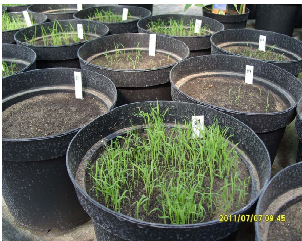
Figure 3. Miscanthus seed germination in pots 图 3. 芒属植物种子在育苗盆内萌发出土

(图 4)。使用灭活的腐殖土。间苗或分苗后 2~3 周, 便可将幼苗移栽到田间。