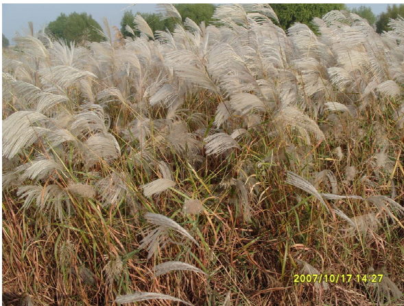
Figure 2. Inflorescence of Miscanthus sacchariflorus 图 2. 芒属植物(荻)的穗头(复总状花序)

播种后 3~4 周, 即出苗后, 幼苗在花盆内生长 2~3 周后, 便可进行间苗或分苗移栽。分苗的容器为穴盘