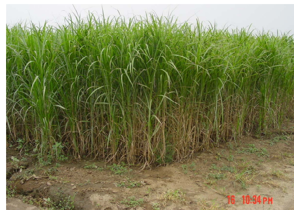
Figure 5. Miscanthus culture in field 图 5. 芒属植物(南荻)的田间栽培