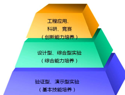
Figure 1. Schematic diagram of three levels

围绕“素质、能力、创新意识”三要素,从培养应用型及创新思维人才的教育目标出发,以加强基础、重视应用、开拓思维、培养能力,提高素质为核心,中心在建设过程中本着既要实现综合育人功能,又要为全校建筑类、化工类、动力机械类等各种学科专业服务,还要为学生提供比较宽阔的大工程背景,尽量拓宽学生的工程意识和视野,着力构建以学生为主体、教师为主导,以培养学生实践能力、综合素质、探索精神、创新能力为宗旨,分层次、多模块的工程实践教学体系,该体系的要件是“一个核心、两个平台、三个层次”的实验教学体系。一个核心是以培养应用型、创新型人才为核心,两个平台是应用能力培养平台和创新能力的培养平台,三个层次是基本技能培养、综合能力培养、创新能力培养三层次[3],如图 1 所示。