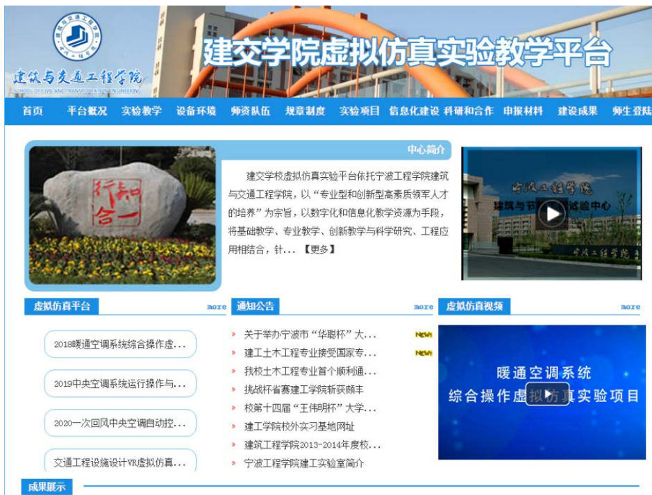
Figure 4. The experimental teaching platform for virtual simulation in school of architecture and traffic engineering