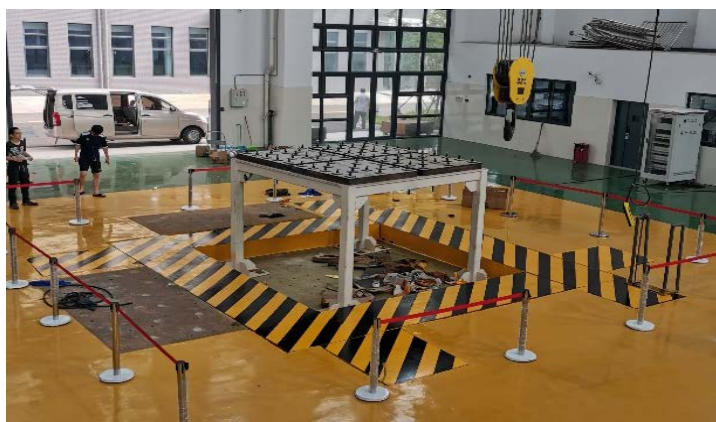
Figure 3. The plain jolter

建筑与交通工程实验实训平台以“专业型和创新型高素质领军人才的培养”为宗旨，以数字化和信息化教学资源为手段，将基础教学、专业教学、创新教学与科学研究、工程应用相结合，针对高成本、高消耗、大型或综合训练以及现有实验实训条件不足的情况，打造出了先进的特色鲜明的虚拟仿真实验教学平台[4]，如图 4 所示，建立了真实实验与虚拟实验有机结合、相互补充的实验教学体系，面向建筑环境与能源应该工程、交通工程和土木工程三个专业，开设了暖通空调系统综合操作虚拟仿真实验项目、中央空调系统运行操作与故障诊断虚拟仿真实验项目、交通工程设施设计 VR 虚拟实验、大数据环境下城市干线道路双向绿波协调控制虚拟仿真实验和混凝土结构试验虚拟仿真实验五个实验项目，并在教学中发挥了重要作用。