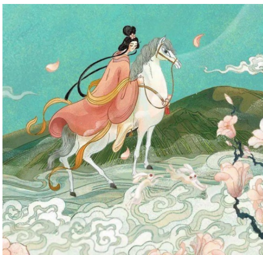
Figure 2. The mulan ballad 图 2. 《木兰辞》 ②

叶露盈用现代美学的手法讲述了中国的传统故事，想让世界更了解中华文化的宏伟壮丽，传统文化的浪漫与美丽；90 后男孩朴缜不为现代感和炫酷感所迷，热衷于展示中国传统元素，有着自己独特的眼光和执着，秉着对艺术的热爱，创作了《东方幻月录》《24 节气》等佳作，如图 3 所示，在他的手里，五千年历史的中国文化重获了不一样的意义，让人觉得精妙绝伦、赞叹不已。