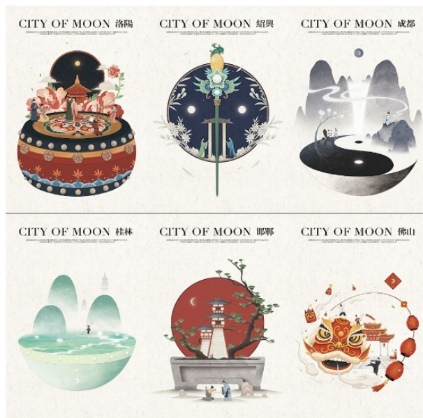
Figure 3. The record of the eastern phantom moon 图 3. 《东方幻月录》③