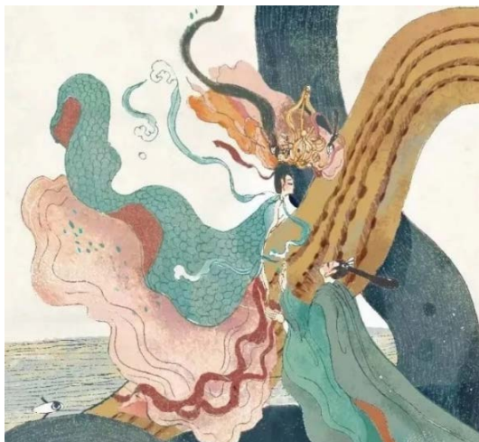
Figure 1. Rhapsody on goddess of luo 图 1. 《洛神赋》 ①

事物发展的方向是前进的、上升的，事物前进的道路是曲折的、迂回的，这是一切事物发展的总趋势，我国插画的发展也是如此。在这曲折的道路上也涌现出很多优秀的插画师，从《洛神赋》《兰亭序》到《木兰辞》绘本，如图 1、图 2 所示。