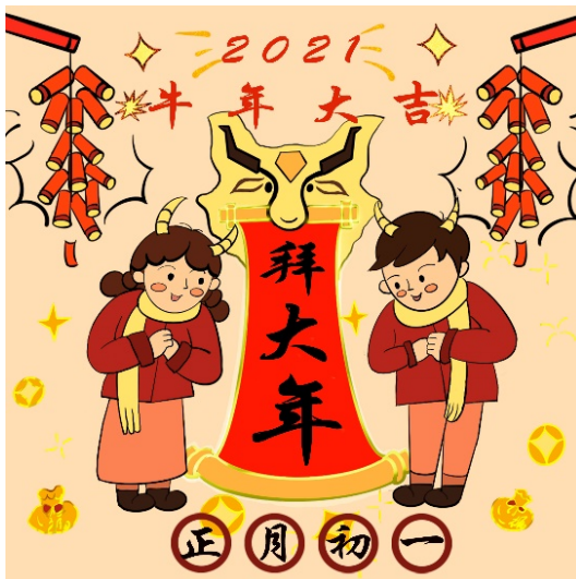
Figure 11. The first day of the first lunar month