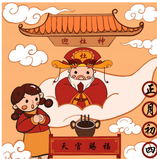
Figure 8. The fourth day of the first lunar month 图 8. 《正月初四》 ⑧