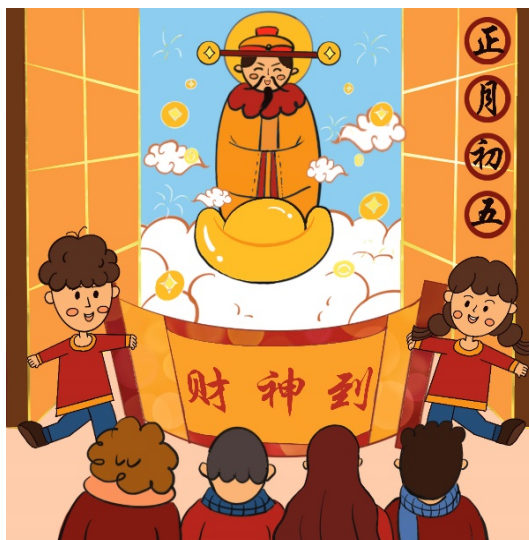
Figure 9. The fourth day of the first lunar month 图 9. 《正月初五》 ⑨

例如作品《正月初一》插画，如图 11，采用了对称式构图，中间是一幅拜大年的卷轴，两个小朋友对称地摆在卷轴的两边，鞭炮分布在上面的两边，字也是对称摆在图中，这样的分布达到了视觉上的平衡，创造了和谐稳定之美，获得心灵的愉悦与满足；同时也能营造出严谨、正式的感觉，因为正月初一是个特殊的日子，代表了新年的起点，中国人在这一天过得也很有正式感，所以采用了对称式构图。