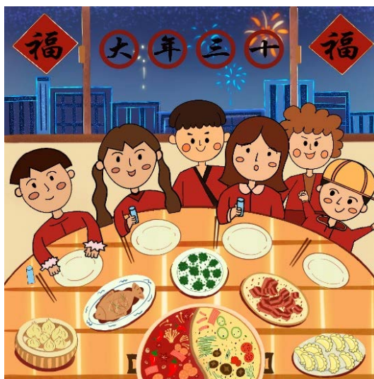
Figure 7. On the 30th of the lunar new year 图7. 《大年三十》 ⑦