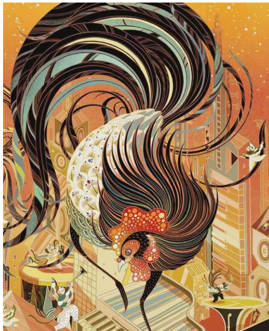
Figure 5. Be born under a Lucky star 图 5. 《吉星高照》 ⑤