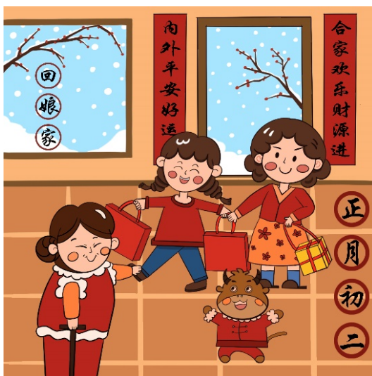
Figure 10. The second day of the first lunar month

插画《过春节》中的线条勾勒也没有用单一的黑色线条, 随着整体或者元素的变化而调整, 也没有一味地追求光影的复杂, 体现整体的装饰美, 如图 10, 整体呈暖色调, 多用红色、橘色、黄棕色、棕色等, 暖色调会让人感觉热情、亲切、振奋、活泼, 更能营造出过年的热闹氛围, 一家欢聚的喜庆气氛。背景的颜色也有考虑进去, 采用明度暗的棕色调, 不抢前面的主体物, 达到整体协调的目的。其中图 11, 多用红色、金黄色装饰, 金黄色使人感到明快、亮丽, 有光明感, 而这一天是大年初一, 是新年的第一天, 人们在爆竹声中开始了对新的一年的期待, 人们都希望以后的日子是光明、吉祥的; 大字选用黑色是因为传统上都是用墨汁写的, 中国书法作品都遵循计白当黑的法则, 朴素的黑色有种返璞归真、趋于