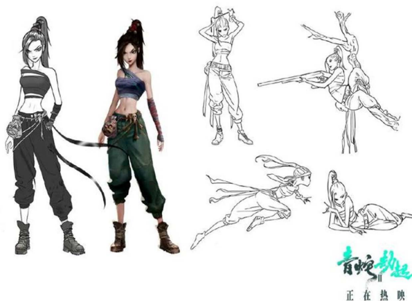
Figure 2. Xiaoqing character design concept of “White Snake 2: Green Snake Robbery”