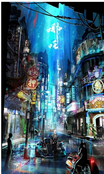
Figure 1. Concept of the scene of the “New Gods List: The Rebirth of Nezha”

时空与文化的重塑有助于打破文化的界限，促进文化交流和创新，但同时也需要谨慎处理，以确保尊重和尊重原始文化的价值和权益。这也反映了后现代文化的动态性和多样性。