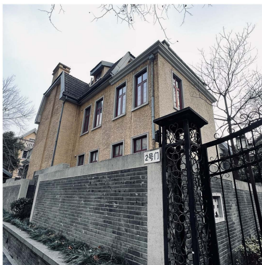
Figure 2. Yihe Road mansion area

颐和路片区作为中国现存少有的完整且大面积的历史文化街区，在建筑价值之外还承载着民国时期中国上流社会精英分子的兴盛和式微，见证了国民党政权的兴盛和衰败。对南京居民来说，颐和路公馆区一直是“上流住宅区”而神秘高雅的代名词，是南京众多历史遗迹中最富有故事传承的地方，浓缩了一个时代的历史记忆(图 2)。颐和路第十二片区经过改造已经成为民国风情休闲旅游区，其中包括以名人公馆改造而成的民国风酒店、艺术风尚街区及品质人文社区，使规划的“游中山陵、观总统府、住公馆区”南京民国旅游线路成为现实。整个片区完整地保留了原有高级住宅区的规划格局、建筑风格与街道尺度，承载着独属南京的民国记忆。作为南京城内最集中展现民国风情、记录民国历史变迁的区域，颐和路片区充分体现其被誉为“一条颐和路，半部民国史”的称号。颐和路的存在不仅是对历史的见证，更是一种文化遗产的珍贵财富，为人们展示了民国时期的风貌和历史变迁，成为连接城市与过去、现在和未来的纽带，彰显了南京作为历史名城的独特魅力(图 3)。