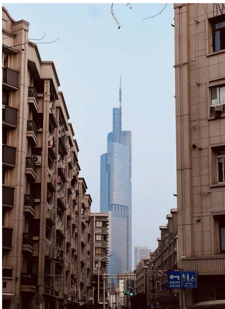
Figure 4. Yihe Road area intersection view 图4. 颐和路片区路口景致

标志物是城市空间的突出标识和象征，它影响着人们对城市的印象和情感。颐和路片区内的标志物主要有两种类型：一种是历史标志物，如名人故居等，它们记录了街区的历史记忆和文化底蕴，增强了街区的品位和气质；另一种是现代标志物，如商业店铺、创意店铺等，它们代表了街区的现代发展和商业活力，展示了街区的时尚风格和生活品味，增强了街区的吸引力和竞争力。历史标志物和现代标志物共同构成了颐和路片区作为城市空间的突出标识和象征，营造了一个具有历史底蕴和现代活力的城市空间形象，给人们留下深刻的印象和情感体验(图4)。