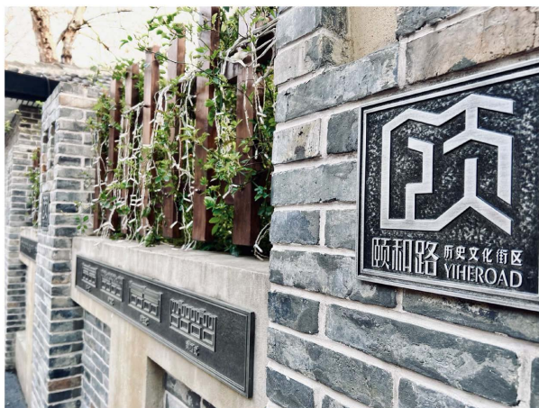
Figure 3. Yihe Road block business card logo