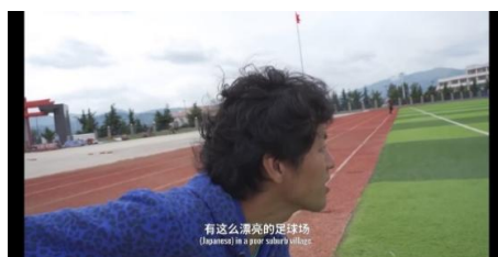
Figure 5. Scenario of using Chinese and Japanese 图 5. 用汉语和日语说话的场景

另一方面, 两种语言同时使用时, 主要是“汉语和日语”、“汉语和彝族语”、“汉语和英语”的组合, 分别为 361.744 秒、53.381 秒、29.762 秒, 其比例分别为 11.60%、1.72%、0.95%。“汉语和日语”中所说的场景, 主要是竹内亮用汉语和日语说话的场景。图 5 是竹内亮用汉语和日语说话的场景。用“汉语和彝族语”说话的场景主要是采访刺绣基地工作人员时的场景。图 6 是竹内亮与刺绣基地工作人员交谈的场景。