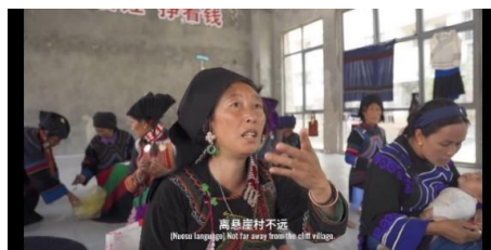
Figure 3. Scenario of using Yi language alone 图 3. 单独使用彝族语的场景

另外, 分析发现单独使用彝族语和英语的情况并不多。约占整体的 0.3%左右。主要是在村里人和外国来的足球教练说话的场合中, 使用的是彝族语和英语。图 3 是单独使用彝族语的场景, 图 4 是单独使用英语的场景。