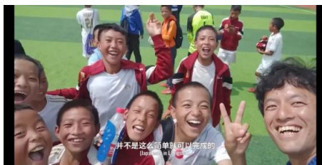
Figure 10. Scenario of upward hand action

间的 0.57%。即表示中的动作的使用频度最高, 其次是向上的动作。图 10、图 11、图 12 是向上的手部动作、中部手部动作、向下的手部动作的场景。