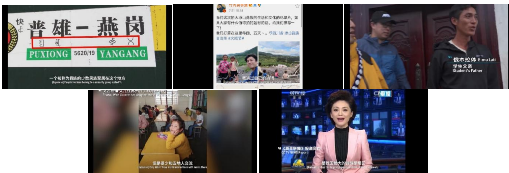
Figure 15. Text scene 图 15. 文字场景