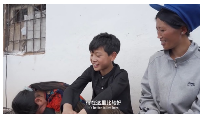
Figure 12. Scenario of downward hand action