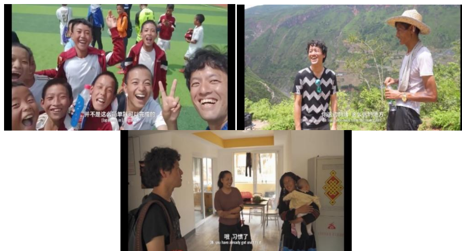
Figure 14. Scenario of short distance, medium distance and long distance