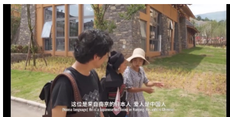
Figure 6. Scenario of using Chinese and Yi language 图 6. 用汉语和彝族语说话的场景