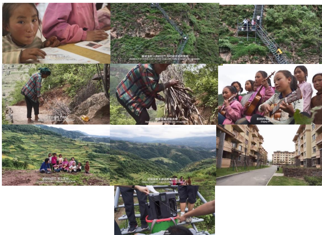
Figure 16. Scenario of screen configuration 图 16. 画面配置的各场景