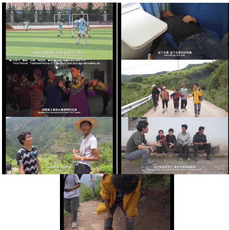
Figure 9. Scenarios of body movements 图 9. 身体动作的各场景

释时间合计为 0.683 秒, 占总时间的 0.02%。总体来说, “坐”和“站”是使用频率最高的, 其次是“走”。下面的图 9 是身体动作的各场景。