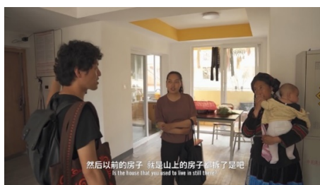
Figure 8. Scenario of using Chinese, Japanese and Yi language 图 8. 用汉语、日语、彝族语说话的场景