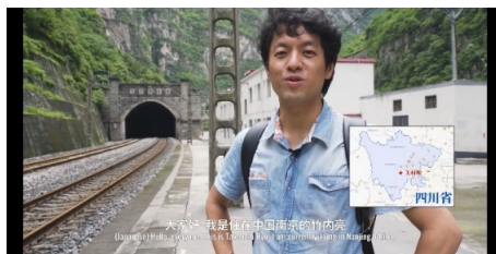
Figure 2. Scenario of using Japanese alone