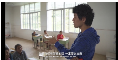
Figure 11. Scenario of middle hand action