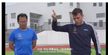
Figure 4. Scenario of using English alone 图 4. 单独使用英语的场景

另一方面, 两种语言同时使用时, 主要是“汉语和日语”、“汉语和彝族语”、“汉语和英语”的组合, 分别为 361.744 秒、53.381 秒、29.762 秒, 其比例分别为 11.60%、1.72%、0.95%。“汉语和日语”中所说的场景, 主要是竹内亮用汉语和日语说话的场景。图 5 是竹内亮用汉语和日语说话的场景。用“汉语和彝族语”说话的场景主要是采访刺绣基地工作人员时的场景。图 6 是竹内亮与刺绣基地工作人员交谈的场景。