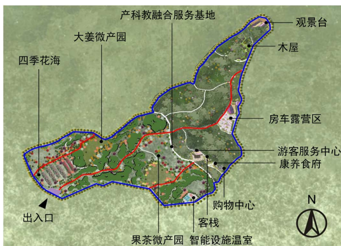
Figure 1. One ring and three corridors multi-format 图1. 一环三廊多业态

围绕定位战略、路径模式和运营机制等多个方面,综合借鉴类似国内外康养休闲度假发展的案例借鉴,确定康养山庄布局思路和发展思路,即:一环三廊多业态(图1)。一环为环山机耕道,三廊为农事体验廊道、康养漫步廊道以及生态景观廊道,多业态为山中氧吧漫步、大姜康养食疗、有机蔬菜体验、康养文化体验。重点打造以下四个功能板块:1) 康养休闲游览功能板块:发展山庄康养农旅度假休闲引领示范区;2) 科技创新引领功能板块:设施农业装备和种植技术创新引领示范区;3) 区域示范联动功能板块:联动乳山市休闲农业升级和发展示范区;4) 农事观光体验功能:山村风情景观休闲观光、互动体验示范区(图2)。