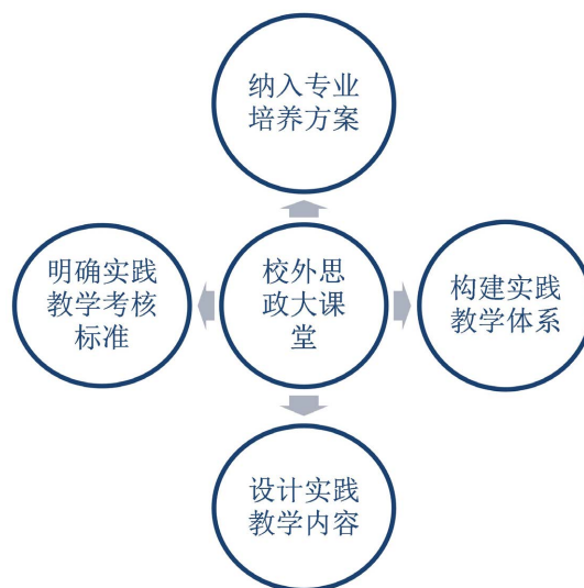
Figure 3. The system of practical education model of “off-campus ideological and political classroom”