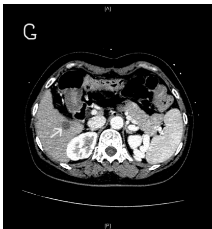
Figure 1. Primary liver cancer (A); first recurrent tumors in lower right anterior lobe (B) and upper right anterior lobe (C); recurrent tumors in the lower right anterior lobe (D) and upper right anterior lobe (E) during immunotherapy; tumors in the lower right anterior lobe (G) and upper right anterior lobe (F) in the second preoperative reexamination

图 1. 原发性肝癌(A); 初次复发的右前叶下段(B)和右前叶上段(C)肿瘤; 免疫治疗过程中右前叶下段(D)和右前叶上段(E)的肿瘤; 第二次术前复查的右前叶下段(G)和右前叶上段(F)的肿瘤