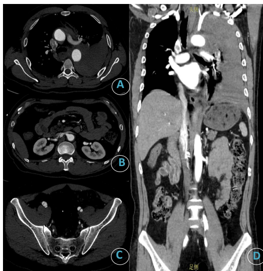
Figure 1. Preoperative imaging data of the patient. (A) Pleural effusion and suspected aortic PAU; (B) renal artery dissection; (C) iliac artery dissection; (D) Aortic coronary position

生化: 尿素氮 7.6 mmol/L, (正常 2.8~7.14 mmol/L); 肌酐 87.10 \mu mol/L (正常 40~135 \mu mol/L)。心脏指标: 肌钙蛋白 T38.3 pg/ml; 肌酸激酶同工酶 1.06 ng/dL。B 型脑钠肽 429.00 pg/ml。患者血沉、抗核抗体谱结果阴性。考虑诊断: 1) 主动脉壁间血肿; 2) 主动脉穿透性溃疡? 3) 左侧胸腔积液伴左肺下叶不张(血胸?); 4) 双肾动脉夹层; 5) 双侧髂外动脉夹层; 6) 左肾动脉扩张; 7) 右侧髂总动脉瘤; 8) 腔隙性脑梗塞; 9) 右肾囊肿; 10) 双侧大隐静脉剥脱术后; 11) 左侧膝关节交叉韧带重建术。