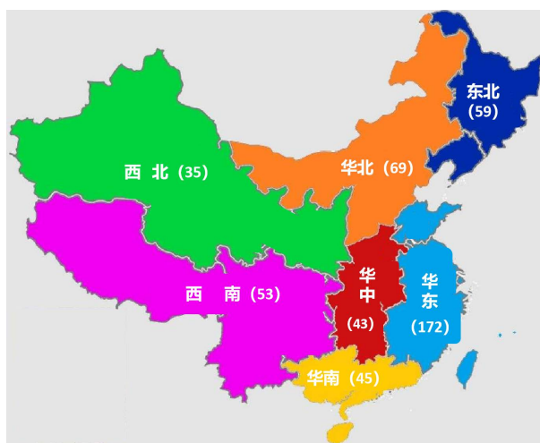
Figure 5. Distribution of the region where the first author is located and the number of documents