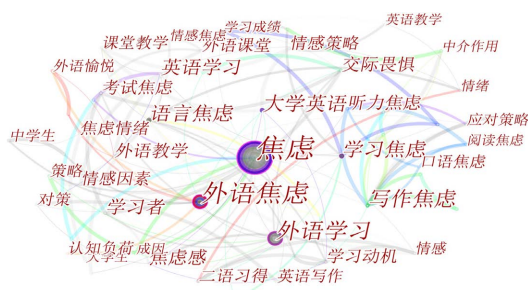
Figure 1. Diagram of the keywords co-occurrence knowledge 图 1. 关键词共现知识图