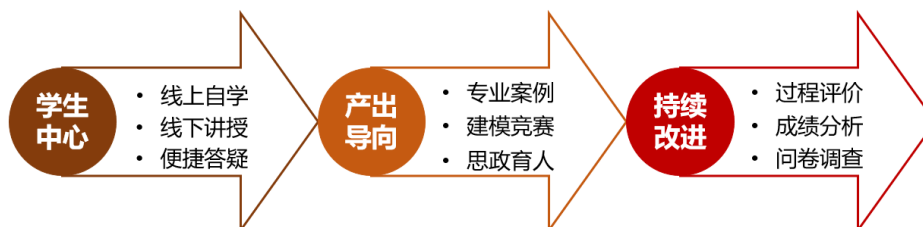
Figure 1. Ideas of teaching reform 图 1. 教学改革思路

在新工科建设背景下，针对计算方法课程教学过程中存在的问题，教学团队充分利用现代化教育技术，在学生线上自学、教师线下讲授、随时随地答疑等环节充分体现“以学生为中心”，通过引入专业教学案例、鼓励学生参加数学建模竞赛、推进课程思政育人等措施突出“以学生成果为导向”，利用过程化评价、电子阅卷成绩分析、学生问卷调查反馈等手段抓好“以持续改进为重点”，对课程进行了教学改革与实践，具体思路如图 1 所示。