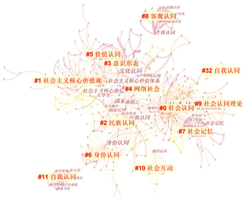
Figure 4. Co-occurrence map of social identity keywords 图 4. 社会认同关键词共现图谱

通过 Citespace 对检索的中文文献进行关键词共现分析，得到的关键词共现图谱如下(图 4)。图中共有 546 个节点，762 个连接，网络密度为 0.0051，整体结构较为松散。根据关键词频次统计可知，除去“社会认同”(频次 188)、“认同”(频次 62)这个代表搜索主题的关键词外，“社会主义核心价值观”及“社会主义核心价值观体系认同”(合计频次 56)出现的次数最多，其次“身份认同”(频次 31)位居第二。“价值认同”(频次 22)、“文化认同”(频次 22)、“大学生”(频次 19)、“国家认同”(频次 19)紧随其后。