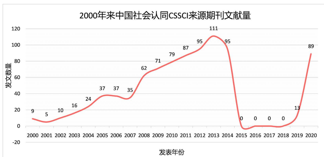
Figure 1. The amount of Chinese social recognition of CSSCI source journals in 2000

某一研究方向的文献发文量能够在一定程度上代表该领域的发展方向、研究趋势和研究现状。对这些文献年度的发文情况的知晓有利于我们对社会认同研究的近况和发展动态有一个较宏观的认识。图 1 呈现社会认同的年度发文量的情况。由图可见，在 2000 年之后，社会认同的研究呈现了“N”字型的研究趋势，从上世纪末开始到 2013 年，社会认同的研究呈现波浪式上升的趋势，总体趋势较为平稳；意外的是，从 2014 年开始，直至 2018 年，社会认同的研究就一直处于半停滞状态，其中在 2015~2018 年的四年当中，中国知网上可查到的社会认同有关文献连续 4 年为 0，在经查验后发现，这期间北大核心的论文发表数量也与此基本一致，一般期刊论文对该领域还偶有研究但同样呈现明显下降趋势，这表明在此期间的研究出现了一定的研究瓶颈或者是社会阻碍，在后面会进行探讨；从 2019 年下半年开始，可以看到社会认同的研究又逐渐的恢复正常，并且在 2020 年已经基本恢复到了发展高峰期的水平，由此可见，社会认同的研究又将再一次地成为学界研究的热点问题之一，并将在未来有一定积极的发展态势。