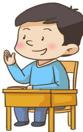
举手 Raise hand