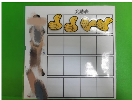
代币表 Token table