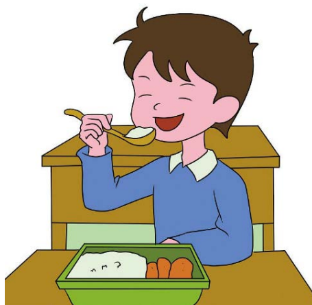
吃自己的食物 Eat your own food