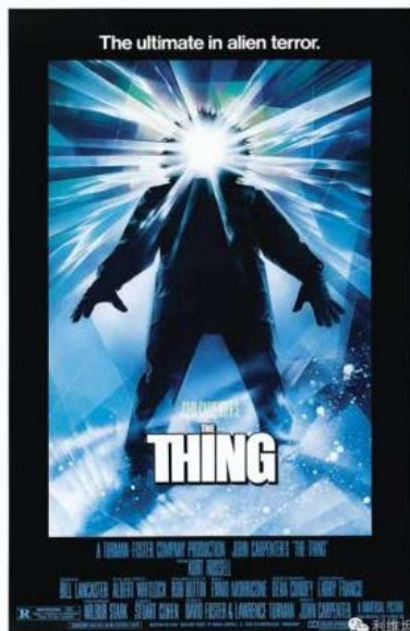
Figure 3. The Thing 图 3. 怪形