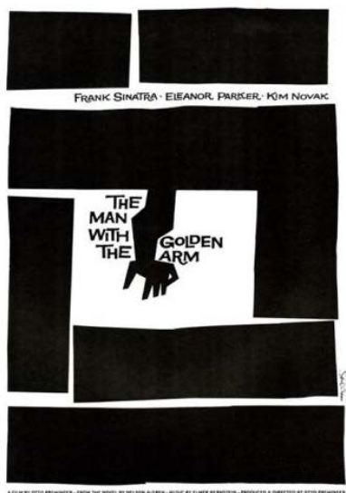
Figure 1. The Man with the Golden Arm 图 1. 金臂人

为此, 纽约平面设计派诞生了, 并且影响了当时的电影海报设计。在五十年代以前, 好莱坞正值黄金时期, 美国的电影海报多以明星的肖像为主。到了 1956 年, 著名纽约平面设计派代表大师索尔·巴斯所设计的《金臂人》(见图 1)这一电影的海报打破了这一传统。