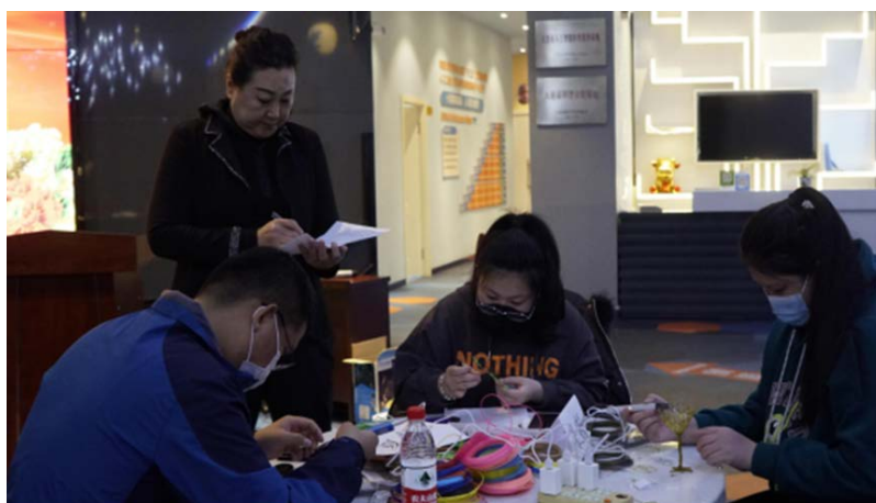
Figure 2. The school teaching in the “front-store and back-school” mode 图 2. 学校在“前店后校”模式下教学

近几年来，各高校为鼓励学生创新创业，开创了“前店后校”模式，希望将知识传授与技能训练进行结合，形成了新的创新创业教育模式(如图 2 所示)。