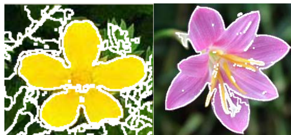
Figure 4. The initial segmentation result 图 4. 初始分割结果