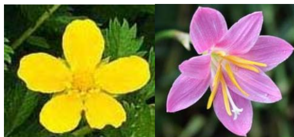
Figure 2. Artwork 图 2. 原图

和区域邻接关系进行种子区域生成和区域合并。该算法克服了传统种子区域生长方法不能自动选择种子且容易导致过分割的局限性。将新的算法应用到彩色图像分割, 能克服图像分割中过分割现象, 而且也能得到与人类视觉判断相一致的有意义区域的分割。本文提出的算法也存在不足之处, 对于具有复杂的彩色或纹理(例如含有很多小目标区域)的图像分割效果有点模糊, 主要由于区域合并中运用到所要合并的区域的外接矩形, 外接矩形的大小会影响到区域合并的效果。图 2 到图 5 分别为原图、颜色空间转化、分水岭算法分割效果、最终分割效果。图 4 的效果是分水岭算法结合了灰度梯度图, 大大减少了分割区域; 图 5 为分割最终效果图, 从中可以很明显的看出花的分割效果, 轮廓很清晰。