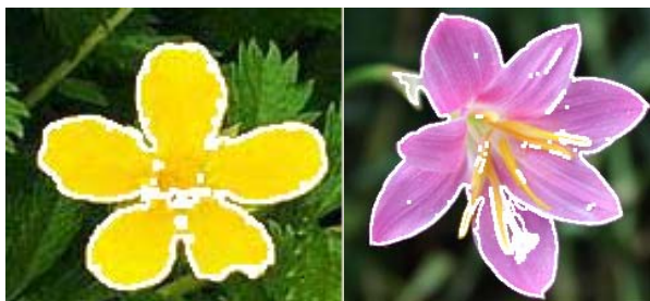
Figure 5. The combined results 图 5. 合并后结果