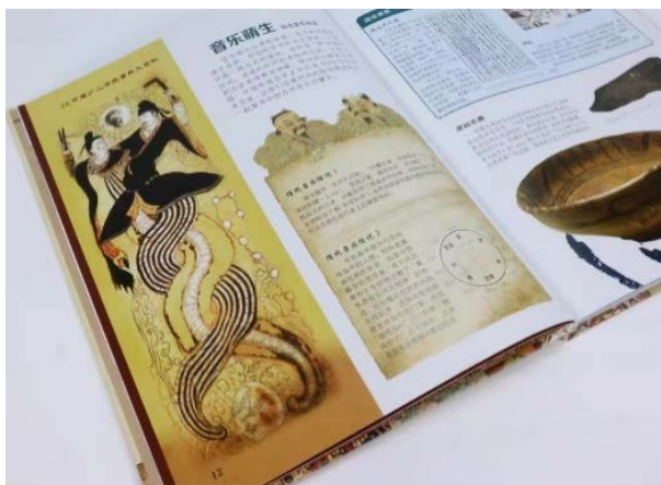
Figure 3. Picture book “encyclopedia of traditional Chinese children’s music”

在交互式绘本设计沉浸式、游戏性、科普性的特征要求下,设计者在进行绘本创作时,首先,要迎合儿童特有的视觉、听觉、触觉兴趣,这样才能吸引儿童注意力,使其身临其境的进入绘本中创造的情境中,沉浸式地感受阅读的魅力;在阅读过程中,设计者要对儿童的互动行为进行研究,这样才能让儿童主动参与到绘本中,并与绘本建立游戏感,从而培养儿童想象力和创造力;在阅读后,儿童往往会有一种成就感,这种成就感来自于对未知事物的了解,这就要求设计者在借助绘本进行知识科普时,采用通俗、易懂的叙述形式,巧妙的将难以理解的专业知识,转化为符合儿童的认知水平的视觉元素。