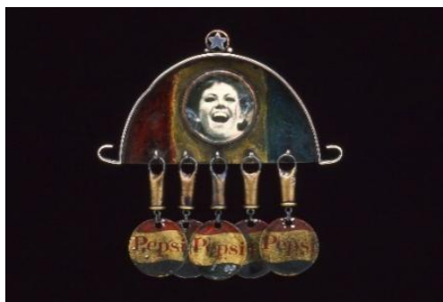
Figure 2. Come alive! You are the Pepsi generation

《活过来! 你们是百事一代》是弗雷德设计的胸针首饰(图 2)。徽章的坠饰由印有百事可乐标志的易拉罐碎片和子弹壳组成, 徽章的上半部分包含一个巨大的笑脸, 这个笑脸是 20 世纪六十年代典型的美国青少年形象, 代表了阳光、简单和快乐。“活过来! 你们是百事一代”是 1964 年百事可乐推出的广告语, 该广告获得了巨大的成功。百事可乐的形象与海上冲浪、郊游骑行等前卫的生活方式联系在一起, 被包装成当代年轻人的身份象征, 而子弹则暗示了美好生活表象之下被忽略的那一部分。弗雷德对人们习以为常的现象保持着一种清醒, 并深信首饰带来的反思的力量。因此, 他主张以大众消费品为材料来攻击它们所影射的消费主义文化。