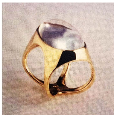
Figure 3. Two ways of wearing the ring 图3. 两种戴法的戒指 ③

创作者对首饰固有结构的创新不是无依据的, 通常针对具体的问题, 提供一个常规解决办法之外的新思路。1956年, 德国当代首饰设计师弗里德里希·贝克尔设计了作品——《两种戴法的戒指》, 创造性地对戒指的结构进行了设计(图3)。面对一颗素面宝石, 设计师为了符合手指竖向的形态通常会选择竖着镶嵌。但贝克尔创作的椭圆宝石戒面既可以是横向的, 也可以是竖向的。《两种戴法的戒指》通过简洁的结构轻松的实现了这一功能, 贝克尔的做法体现了创作者对于专业内习以为常问题的反思, 并给出了创造性的回答。