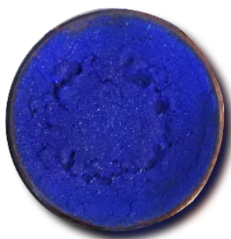
Figure 5. Texture of enamel icing 图5. 珐琅糖霜肌理 ⑤