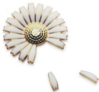
Figure 1. He loves me, he doesn't love me