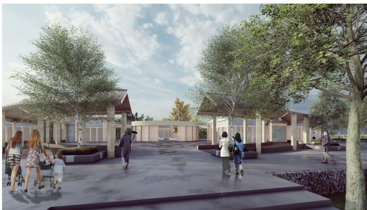
Figure 1. Renderings of public space 图 1. 公共空间效果图

以容纳不同类型的社交活动, 促进居民之间的交流和互动。此外, 可以引入互联网科技, 提供信息交流平台, 方便居民获取社区信息和参与社区事务。