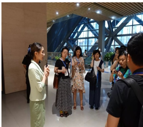
Figure 3. Clothing of the Explanators at the Sanxingdui Museum 图3. 三星堆博物馆讲解人员服饰 ®

对于人体由于不在其受束缚, 以便服装后期加工, 避免受到其限制。基于此, 对于服装设计师而言不管是在服装局部上, 还是其零部件上, 应合理的去应用三星堆青铜器廓形[6]。以三星堆博物馆讲解人员服装设计(见图3)为例, 在具体设计的过程中, 应注重对传统西服款式为例, 在服装门领处, 合理的利用三星堆遗址中青铜器, 以青铜色颜色的青绿色为其主色, 同时还应注重对面料的利用, 把其三星青铜器的特点充分表现出来, 尤其是夸张这一特点[7]。