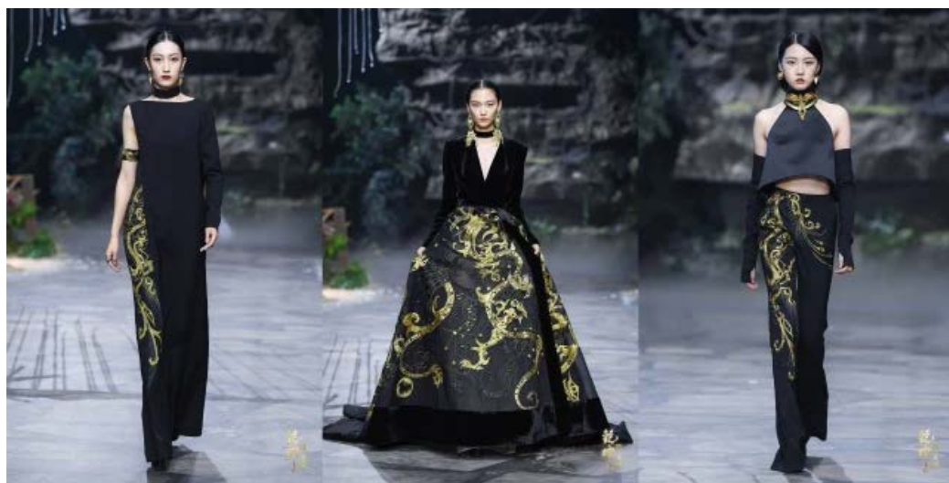
Figure 2. "Tao Tie Wen Shu" 图 2. 《饕餮纹书》 ②

以中国著名设计师熊英设计的《饕餮纹书》系列(见图 2)为例, 其设计灵感来自青铜器上饕餮纹, 以青铜器的青色与黑色为主色, 青色黑色相得映彰如一场饕餮盛宴。