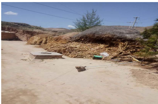
Figure 4. Li Yaoxiong village water cellar in Er tiao villages , Mao Jing Township, Huan County, Qingyang, Gansu 图 4. 甘肃庆阳环县毛井乡二条硷村李耀雄农户水窖