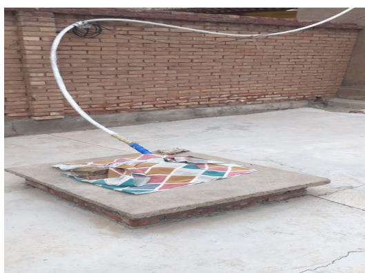
Figure 6. He Zhengfu village water cellar in Yang Dong Zhang village, Mao Jing Township, Huan County, Qingyang, Gansu 图 6. 甘肃庆阳环县毛井乡杨东掌村芦草渠自然村何正富农户水窖