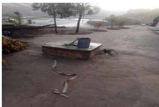
Figure 5. Li Zhijiang village water cellar in Yang Dong Zhang village, Mao Jing Township, Huan County, Qingyang, Gansu 图 5. 甘肃庆阳环县毛井乡杨东掌村芦草渠自然村李治江农户水窖