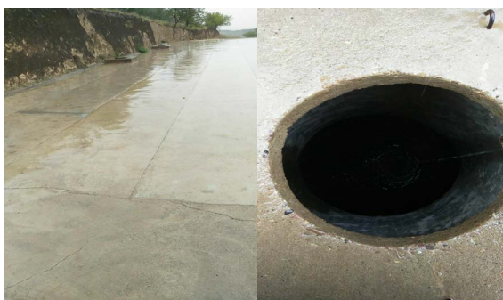
Figure 3. Xu Zhaosheng village water cellar in Long Bai Shan village, Mao Jing Township, Huan County, Qingyang, Gansu 图 3. 甘肃庆阳环县毛井乡龙柏山村阴庄自然村徐朝生农户水窖