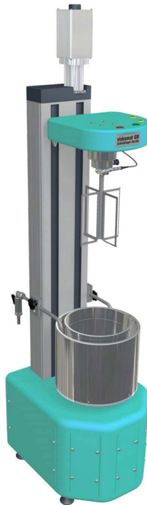
Figure 1. Viskomat XL concrete-mortar rheometer 图 1. Viskomat XL 型混凝土 - 砂浆流变仪

Viskomat XL 型混凝土流变仪包括一个 3 升的反应池和适合用于混凝土和砂浆的探针，可测量 8 毫米直径的骨料颗粒；浇注料物料允许颗粒尺寸为 16 mm，旋转速度范围为 0.001 到 220 转每分钟，可顺时针或逆时针双向旋转，扭矩测量范围为 0 至 300 Ncm，测量分辨率为 0.05 Ncm，准确度优于 0.2 Ncm。样品的温度控制是通过双层杯壁的反应池实现的，循环液体在双层杯壁中流动调节反应池的温度；样品的温度测量是通过探针内的温度传感器完成的。