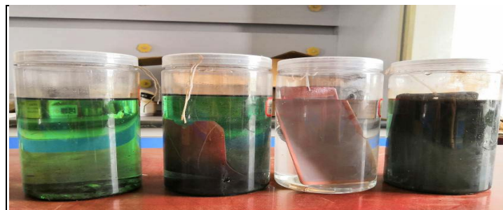
Figure 3. Corrosion of each test panel after immersed in dilute sulfuric acid for 25 days (60°C)