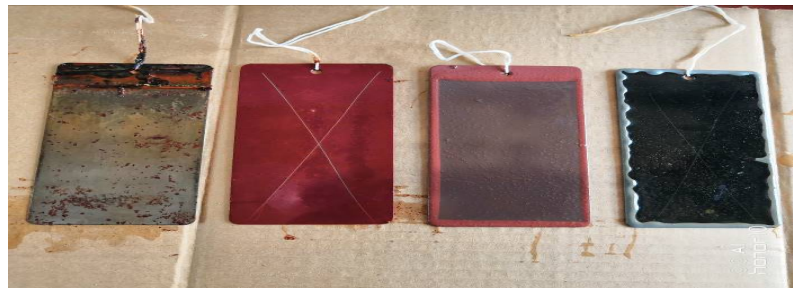
Figure 1. Corrosion of each test panel after immersed in oil-bearing produced water for 25 days (60°C)