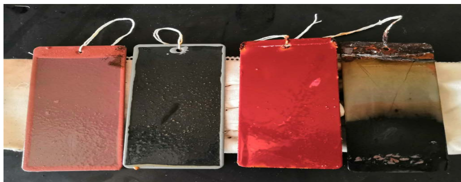
Figure 4. Corrosion of each test panel after immersed in oil-bearing produced water for 40 days (60°C)