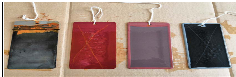
Figure 2. Corrosion of each test panel after immersed in salt water for 25 days (60°C)