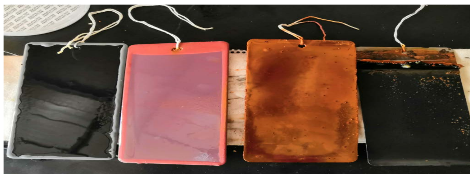
Figure 5. Corrosion of each test panel after immersed in salt water for 40 days (60°C)