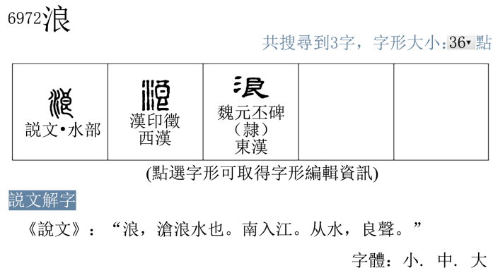
Figure 1. The glyph evolution of “Làng” 图 1. “浪” 的字形演变