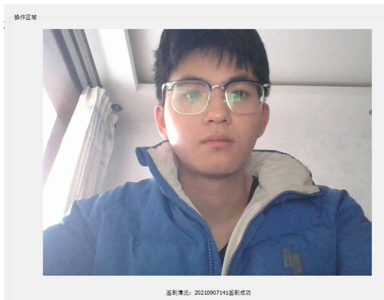
Figure 6. Sign-in successful interface 图 6. 签到成功界面

而在人脸签到功能中，学生点击“人脸签到”按钮后，系统同样调用摄像头功能。获取摄像头画面并将图片转为 base64 编码格式，接着使用百度 AI 的人脸搜索接口，查询学生是否已注册的人脸信息。