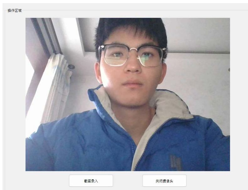
Figure 5. Face entry interface 图 5. 人脸录入界面

效果，系统要求学生以正脸出现在画面中，并且图像中不包含多个人脸[7]。这一要求通过使用 OpenCV 库获取摄像头画面，将图像转为 base64 编码格式实现。接着，利用百度 AI 的人脸注册接口，将学生的人脸信息以 base64 编码形式发送至百度服务器，完成人脸的注册。注册成功后，系统将展示人脸注册成功的提示信息，具体的实现如图 5 所示。