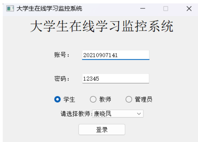
Figure 2. User login interface 图 2. 用户登录界面

与 MySQL 云数据库的交互, 检查用户输入的账号密码是否匹配, 并返回相应的用户信息, 通过 PyMySQL 库实现与数据库的连接和数据操作。验证成功后, 系统将隐藏登录界面, 并根据用户身份展示相应的主界面, 如学生界面、教师界面或管理员界面。具体实现界面如图 2 所示。