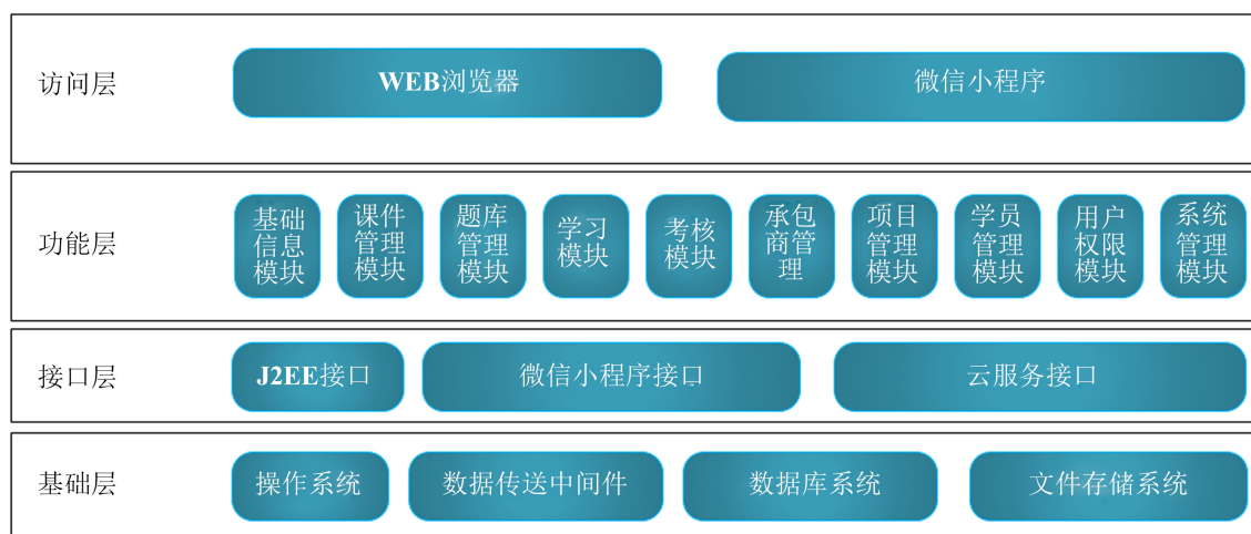
Figure 1. Technical architecture of the system

根据系统的设计思路，合理组织模块功能，系统的技术架构如下图 1 所示，在框架中通过 Web 前端技术的分层，对气矿企业需要建立的 HSE 培训系统进行划分，主要目的是为气矿现场的工作人员进行 HSE 意识的培训，减少安全事故的发生降低经济的损失。