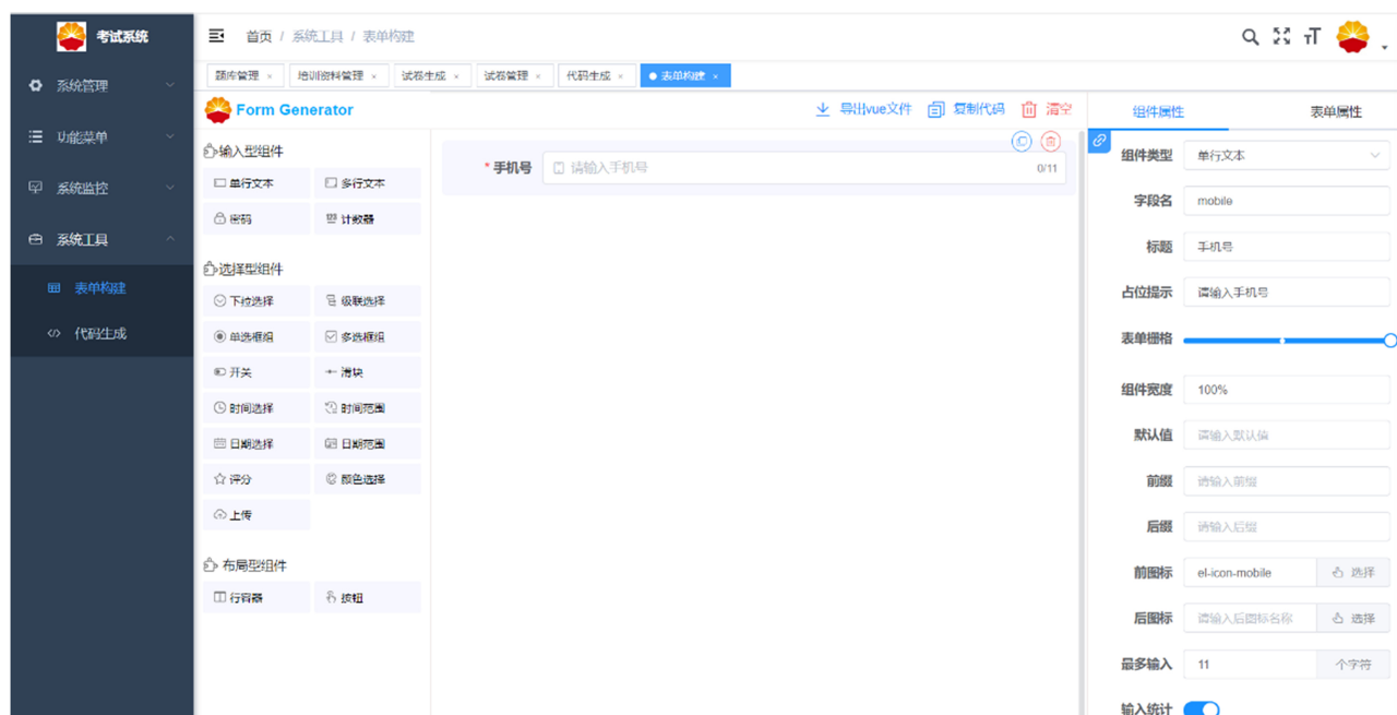
Figure 3. System tool operation interface