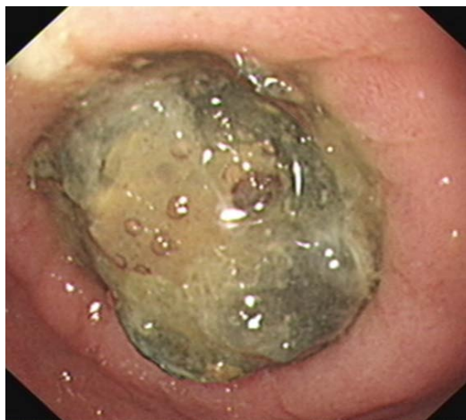
Figure 1. Gastroscopy showed huge stones and obstruction at the pyloric orifice 图 1. 胃镜示幽门口巨大结石并梗阻

白本身不溶于水，而易于与植物纤维融合成块沉淀在胃部形成胃石。胃石形成后很难以自行排出，且巨大胃石可持续摩擦或压迫胃肠道粘膜致粘膜糜烂、溃疡，严重者可造成出血、穿孔、梗阻等多种并发症[3]。