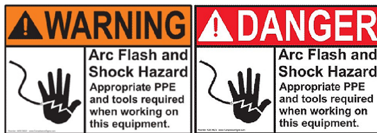
Figure 3. Arc flash and shock tags

电弧闪络计算采用“入射能量分析方法”，并按规定安装电弧闪络和冲击危险警告标签。图 3 是电弧闪络和冲击警告标签。指导小组决定将电弧防护设备标准化，电热性能值最低为 8 \text{ cal/cm}^2 。