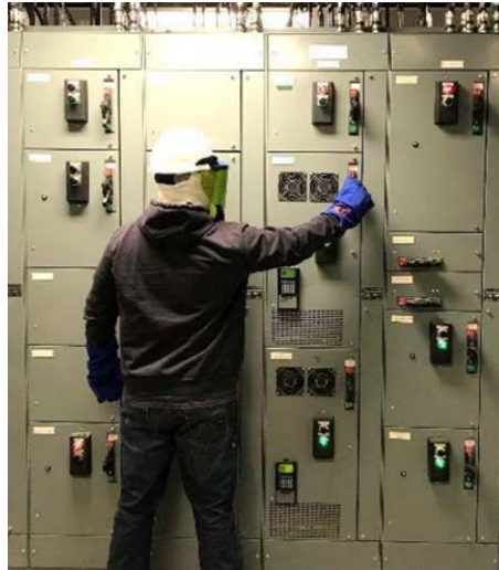
Figure 4. Typical good practice 图 4. 典型的良好操作规范

和带皮革保护的绝缘(橡胶)手套。电弧闪络风险评估的解决方案包括基本个人防护装备、附加个人防护装备、远程开关设备执行器(RDA)和与辐射能量匹配的电弧闪络防护服,如表 5 所示,对每个角色的期望都作为解决方案的一部分建立起来。