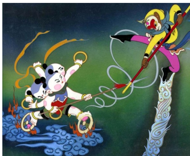
Figure 12. The Monkey King