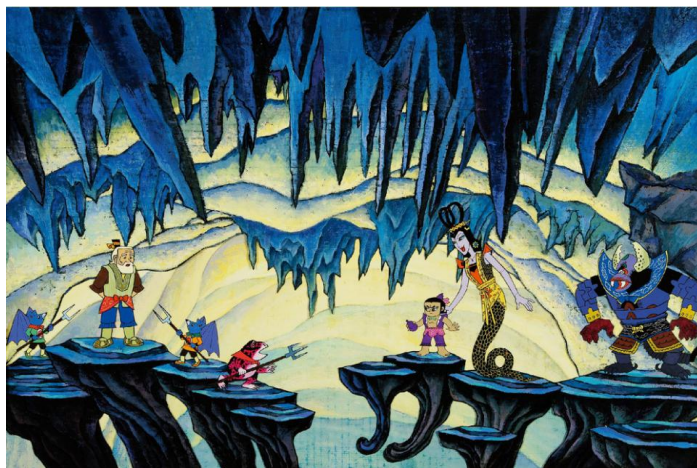
Figure 7. (Seven) Calabash Brothers 图 7. 《葫芦娃》动画