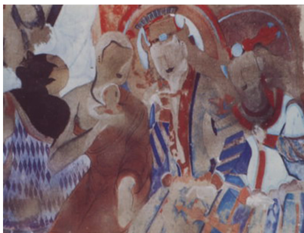
Figure 9. Kizil Buddhist Caves 图 9. 克孜尔千佛洞