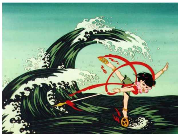
Figure 4. Nezha Conquers the Dragon King