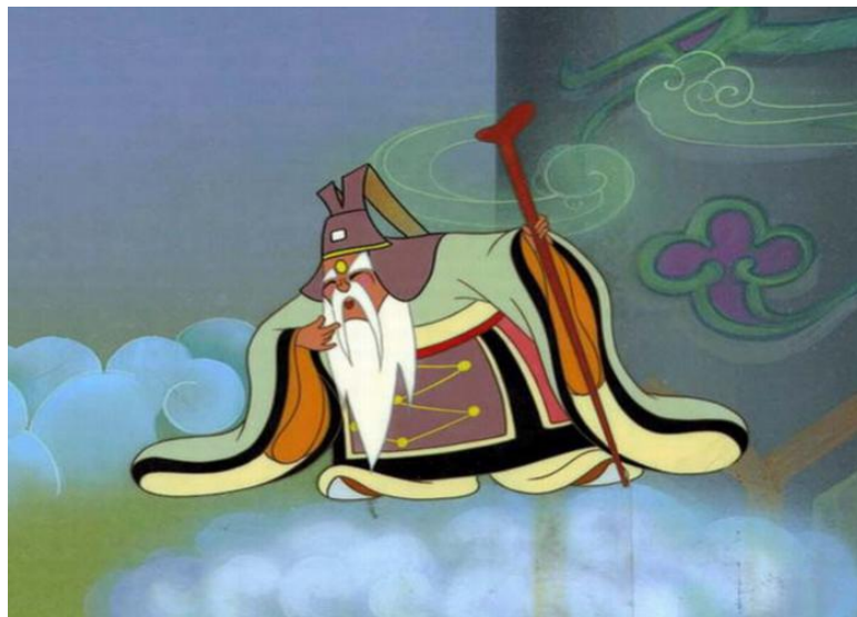
Figure 1. The Monkey King 图 1. 《大闹天宫》