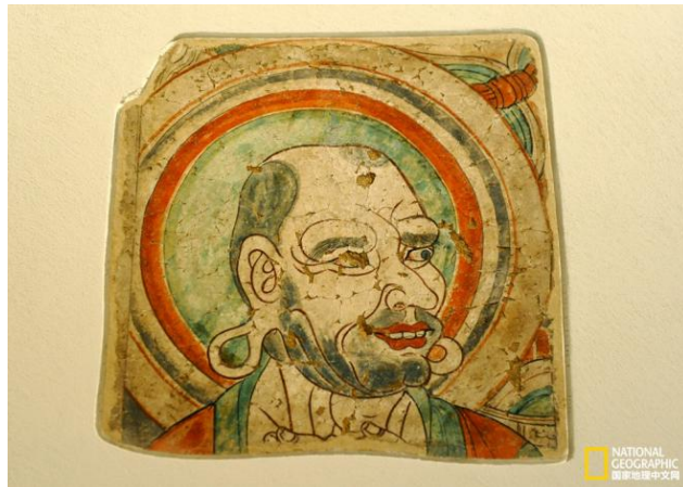
Figure 10. Cave paintings in Xinjiang Bezkilik Grottoes 图 10. 新疆柏孜克里克石窟壁画

在装饰图案上，我国早期本土的动画作品中的可视化图形元素也可在丝路文化的长河中找寻根基。早在我国西北地区丝绸之路沿途为中国汉唐时期，出土的刺绣为早期动画的装饰图案提供了丰富的材料资源。汉唐时期的刺绣图案构图主要有并列式、二二错排式、对称均匀式、几何骨架式和自由式五种类型。并且每种形式又可细分为多种更具体的图案形式，丰富的构图形式反映了先人的细腻而有序的设计思想并给现代艺术创作提供了很大的启发与帮助。其中一些花草动物纹，以漩涡形卷草最为有特点，还有一些金钟花、豆荚形对叶、回形纹等大量被运用在动画作品的装饰元素中，如各种祥云的形态、云雾升腾、仙境光晕、兵器与首饰的装饰以及在整体的镜头构图中所运用。例如一些装饰的各种对称手法，在运用于动画画面中后，会给人以很古朴精致的美学感受，仿佛每一个镜头都是一副精心设计好的装饰画一样，主体与环境的比例大小、图案在画面中的对称旋转交错排列，都会增强设计感，突出每一个镜头要表达的中心，最重要的是给人一种浑厚浓烈的历史感。