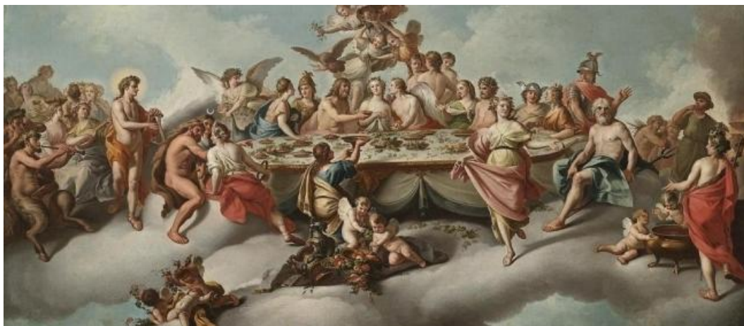
Figure 2. Greek mythology 图 2. 希腊神话

胸、和腰部的动态是轻盈且细腻的，即使有大幅度的动作，但也不会生硬粗狂。在《哪吒闹海》、《九色鹿》、《金猴降妖》中有不少人物形象是带有红色披巾的，披巾总是随风漂浮在半空，使场面气氛仙气十足，而这会不禁让人联想到飞天的画面。在各种不同的洞窟壁画中最引人入胜、赏心悦目的也便是飞天的形象了，人物凌空飞舞，姿态各异，飘带飞动，体态轻盈，面容沉稳，将这样一组画面融入动画的设定中，一定会给观者带来很凌空升华的感受。而在动画中，创作者们将人物形象制作的更加亲切，去除了繁琐的元素，用简练概括的线条，绘制出了一个令人印象深刻的角色形象，富有魅力。