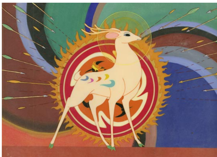
Figure 6. Nine Colored Deer