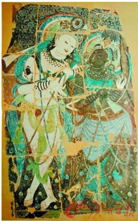
Figure 3. 17th Caves painting, King Jiandapo of Xinjiang Kizil