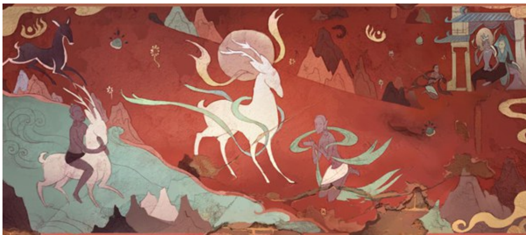
Figure 5. Nine Colored Deer

没有负担的温润感(如图 5, 图 6)。而与之类似的动画作品中还可以看到唐三彩色调的影子。唐三彩, 都是以铜、铁、钴、锰四种原料为主, 其中最具特色的是蓝油, 作为唐三彩釉的代表性釉色。在唐三彩中这种特殊的釉料呈现为美丽的蓝色, 在唐代之前的中国色彩史上, 蓝色并不被广泛的使用, 甚至几乎没有使用蓝色的代表性作品。之后随着古代中亚商人东来, 在瓷器上才开始使用这种特殊的蓝釉料, 并且和其他釉色交织在一起, 形成了富有异域风情的绚丽夺目、五彩斑斓的艺术效果。在我国早期本土优秀动画作品中可见这种蓝色也被大面积的使用其中, 如《葫芦娃》中山石及邪恶部分的色彩倾向, 都大量选用了蓝色, 将画面渲染的冰冷且严肃, 与主人公形象的暖色系火热感形成鲜明对比, 对突出主体人物、渲染故事情节都起到了很好的推动作用, 而创作者也将这种蓝用作一个给作品“降温”和烘托情节转折的有效手段(如图 7~10)。不仅如此, 最早在新疆克孜尔石窟被发现的中国古代青金石颜料的使用, 也为动画作品中的冷色调提供了很好的借鉴作用[7]。青金石是具有天然美丽的蓝色颜料, 其因“色相如天”, 亦称“帝青色”或“宝青色”, 自古十分受到中外帝王的喜爱, 所以在古代多被用来制作皇室的各种玉器工艺和壁画绘制颜料。敦煌石窟是应用青金石颜料时间最久也使用量最多的地点之一。