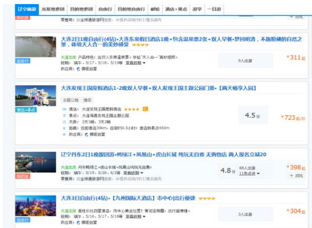
Figure 4. Some tourist routes in Liaoning Province