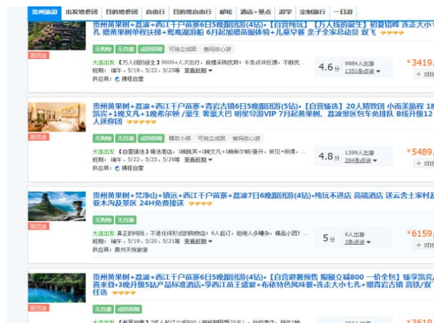
Figure 3. Ctrip's Dalian Departs from Guizhou Province on some tourist routes

贵州旅游的快速发展还得益于其不断完善的公共服务设施。从 2013 年开始，贵阳市依托不断优化的高速立体交通格局，开展旅游景区网络化布局，实施《贵州省“快旅慢游”交通服务体系建设三年行动计划》，在全省布局了一批功能较为完善的旅游咨询服务中心，加快大黄果树旅游圈、环梵净山、沿赤水河等旅游循环交通体系建设，一批旅游公交和景区直通车开通运行，机场、车站和旅游景区交通加快