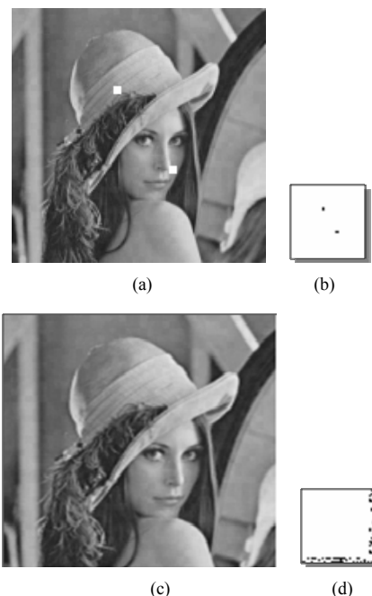
Figure 3. (a) Tampering with the two 8 \times 8 image watermarks; (b) The identified watermark tampering domain; (c) Shearing 10% of the lower right image; (d) The extracted watermark ( ER = 0.623 ) 图 3. (a) 篡改 2 个 8 \times 8 块后图像; (b) 鉴别出的水印篡改域; (c) 剪切右下 10%区域的图像; (d) 提取的水印( ER = 0.623 )

本文基于 DCT 变换、SVD 变换和 Watson 视觉模型探讨了半脆弱水印算法的设计。本文通过引入抖动参数来控制不同图像子块被嵌入水印的强度, 改进已有算法的策略, 提高半脆弱水印性能。通过仿真实验, 该算法能很好地区分合理失真和不合理失真, 还能较准确识别出恶意篡改位置, 而且提取和定位的速度很