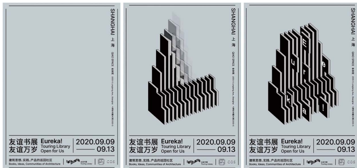
Figure 2. 2020 Shanghai station dynamic poster for the friendship book exhibition