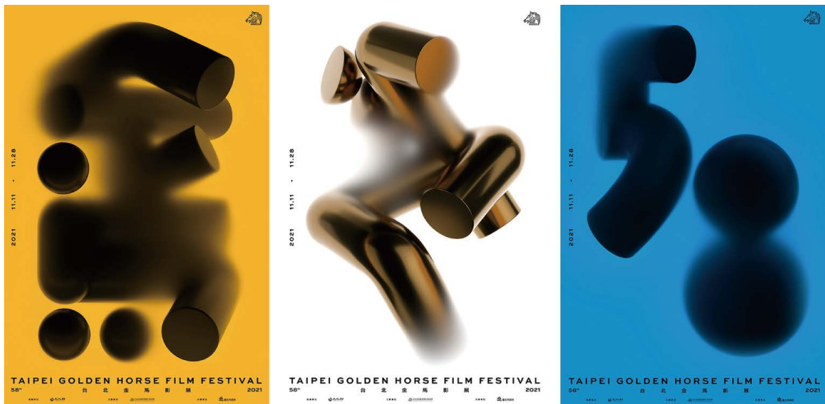
Figure 4. The 58th Golden Horse Film Festival's main visual dynamic poster