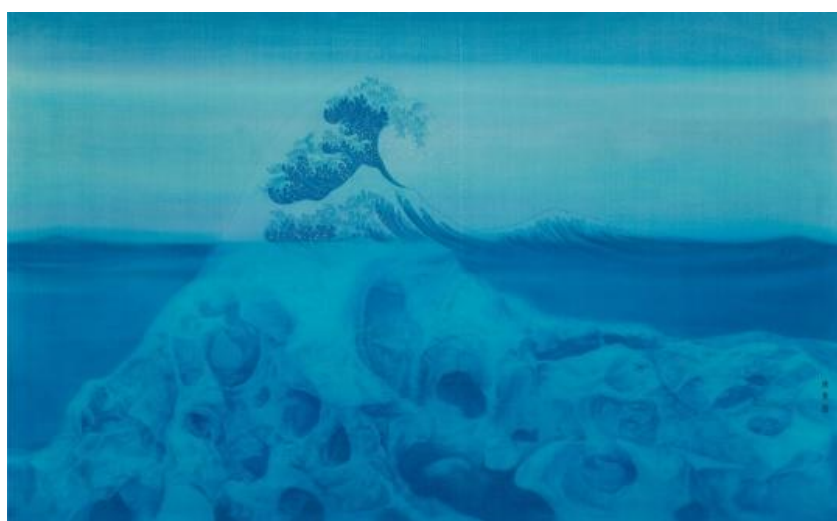
Figure 2. Xu Lei, island stone 图 2. 徐累《岛石》 ②

视觉传达设计恰好与当代工笔画有极大的“共生”可能与可行性。尽管工笔画注重线条，但它也同