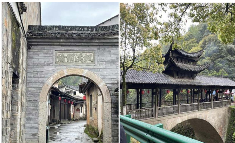
Figure 1. The local cultural environment of the 28 Du town 图 1. 廿八都当地人文环境

地理特色。同时也对当地人群进行了一定量的问卷调查记录。希望可以从中搜集、归纳、总结出一套廿八都非遗木偶戏的传承模式, 或廿八都当地传统非遗文明的复兴路径。在廿八都当地的三十份问卷调研中, 近 70% 的人都熟知廿八都木偶戏, 年龄分布较为平均, 学生占比约为 30%, 退休人群约占 50%, 其余部分为中年群体。在江山市区(距离较远)的三十份问卷调研中, 仅有不到 20% 的人熟知廿八都木偶戏, 其中 70% 以上都是已经退休, 岁数比较大的老人。廿八都木偶戏在年轻一代群体中的传播范围不广、熟悉程度不深等等都可以看出, 对于廿八都木偶戏的传承保护迫在眉睫。