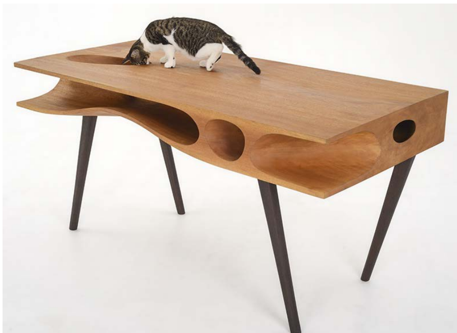
Figure 2. Human pet symbiotic cat table (selected from One Zero Urban Design)

饲主与宠物生活在同一个环境之下, 二者之间互为“共生关系”, 这就要求设计师设计智能宠物用品时扩展设计、风格、形式和内容, 而且还兼顾产品实用性能。贯彻共享化设计原则下研究宠物用品, 充分考虑到人宠之间存在的共生需求。满足城市社会环境的需要, 共享家庭空间的需求, 实现饲主和宠物之间的和谐共存。例如市面上的一款基于人宠共生的猫桌, 充分贯彻共生理念以及饲主和猫的需要, 可以通过猫桌工作学习还可以作为猫的娱乐场地, 可以引导猫在猫桌下面的孔洞中灵活移动, 把智能家具作为中介从而加强主人与猫咪之间的互动乐趣(见图 2)。提高饲主和宠物的交互体验, 把实用性和使用价值在宠物用品中发挥极致, 实现人宠共生。