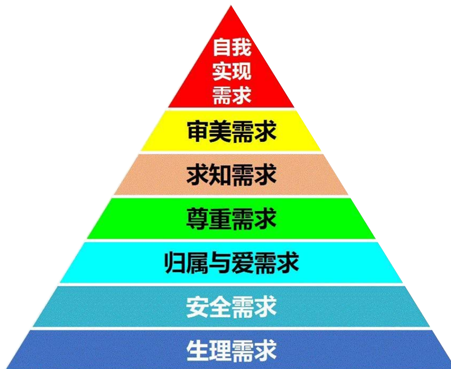
Figure 1. Maslow's hierarchy of needs (selected from the Wiki Shared Resource)

相对于功能需求来说饲主的第一印象往往是产品外观上是否达到其审美点。本质上符合人类审美的宠物用品是人类创造自己内心对美的追求而设计出的产物在马斯洛需求的七个层次中(见图 1), 审美需求占到第六层, 也就是说人们在满足自身的基本需求之后才会考虑审美需求, 而且经济水平生活质量越高对美的要求也会提升, 以满足自身的精神需求。随着社会经济的不断提高, 生活的品质也不断上升, 随之审美文化形态也越来越成熟, 宠物用品的使用、外形、配饰成为了饲养者的审美体现[5]。现在人们对美的需求已经到达社会生活的方方面面, 宠物用品作为人类与宠物交流的重要枢纽, 是不可缺失的重要环节, 审美需求是共生理念中不可缺失的一项。