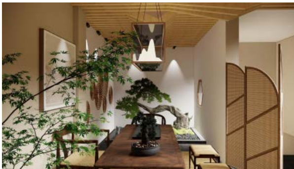
Figure 2. Tea room