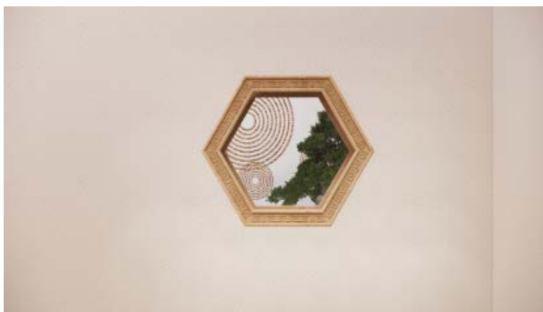
Figure 3. Framed view of the tea room