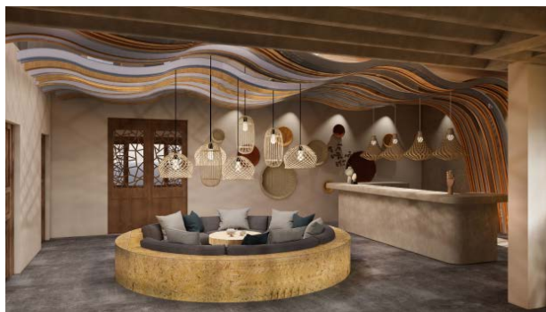
Figure 4. Lobby of rural B & B

乡村民宿的色彩应用也是室内设计中最易被人感知及引起共鸣的, 暖色系能够给人以温馨舒适的感觉, 冷色系则给人以安静沉稳的感觉, 空间设计营造时适当地使用色彩特性, 吸引民宿空间中游客的注意力。不同的色彩会给人带来不同的情感变化, 联庆村位于江南地区, 由于江南地区的地理、自然环境及气候, 江南水乡传统民居建筑有“粉墙黛瓦”的特性, 民宿建筑还原江南传统民居建筑风貌, 建筑色调素雅, 白墙青瓦, 黑白相宜, 恰似一幅水墨画。民宿空间的主色调提取水稻颜色, 回归自然, 给人以温馨舒适的感觉, 富有浓厚的乡土氛围。在民宿大堂设计时提取成熟水稻的颜色作为空间的主色调, 吊顶提取了湖水的流动的形态及颜色, 沙发、吧台都采用了健康无醛稻草板(如图4); 休憩区的主题颜色也是提取水稻的颜色, 天然的家具材质创造出简朴、自然的氛围; 茶室设计营造也提取了水稻颜色作为空间主色调, 营造温馨互动空间氛围的同时体现联庆村水稻文化特色; 民宿空间中的亲子互动活动区的书墙提取成熟水稻的颜色及湖水的流动形态, 在颜色和造型方面都能抓住儿童的眼球, 空间设计诠释“以游戏为基本活动, 寓教育于各项生活之中”孩子在玩耍的同时也能科普水稻文化(如图5)。稻田文化主题民宿还原江南传统民居建筑风貌, 白墙、青瓦、木色, 搭配素雅的装饰, 为游客提供一个清净淡雅、乡土气息浓厚的江南韵味民宿。