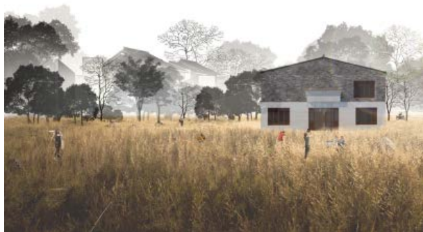
Figure 1. Rural lodging building 图 1. 乡村民宿建筑

此次改造的稻田文化主题民宿位于联庆村正祥寨桥老鹅馆,正祥寨桥老鹅的烧制技艺在 2014 年被评为武进区非物质文化遗产,特色美食也是地域文化的重要组成部分,将其改造为民宿会有很大的发展前景。原有建筑外墙镶贴了墙砖,室内装饰设计粗糙,建筑整体氛围未能体现江南建筑风貌特征。在对其改造设计时,尽量不破坏原建筑柱结构的基础上,秉持“微改造,精提升”的理念进行改造,外观还原传统江南建筑粉墙黛瓦特性的基础上进行创新(如图 1),乡村民宿设计以木材装饰为主,门窗以几何图案的木雕形式装饰[7];室内装饰营造部分的处理秉持人与自然和谐共生的理念,建筑装饰材料以木材料为主,因地制宜,就地取材,尽量使用本地乡土材料及天然材料,如民宿大堂的圆形沙发用的是当地的健康无醛稻草板,在此基础上结合现代人生活方式进行改良设计,造型新颖且便于游客间的互动交流,强化游客与乡村民宿之间的情感联系,唤起村民共有的文化记忆;在民宿二楼的茶室等空间营造中窗框的设计借鉴苏式园林中框景的手法(如图 2 和图 3),上二楼通过框景就可以看到茶室内的景物,窗框内外空间相互交融,游客可以体验到虚实结合、藏露相显的多样性空间效果,这些框景的借鉴设计体现了传统风貌的再现与现代技术的融合。乡村民宿的营造植入了江南传统民居建筑的精神及特征,尊重联庆村文化脉络,保留原有建筑的时空记忆,通过设计运营,将历史旧物融入到民宿装饰设计中,赋予原本闲置的老宅新的生命,使其成为既有时代记忆又能满足人们当前生活和使用需求的居住空间,较好的还原了江南传统建筑风貌[8]。