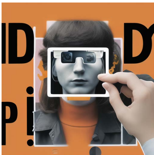
Figure 2. Digital redesign of Dada art 图 2. 达达主义艺术品数字化再设计 ②