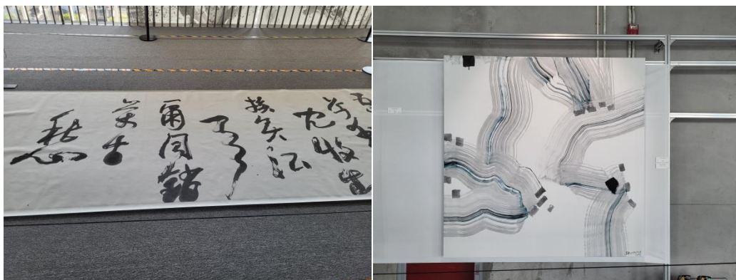
Figure 2. Calligraphy exhibition “Artist’s Career and Path of Faith” 图2. “艺术家生涯·信念之路”书法展

笔者从物理空间与网络空间两个层面来看书法环境中所包含的至简之道。物理空间层面，至简书法展的空间布局坚持“以简为美”，所展出的作品也是遵循至简之道，同时这些空间多为面向大众的免费公共空间。以笔者所在的杭州地区的书法展为例，在今年的“倂光掠影·追寻不断消失的现实之外”、“艺术家生涯·信念之路”、“西湖志·不亦快哉”等书法展览的空间布局以及书法作品设计中均可以看见“至简”理念的运用。“艺术家生涯·信念之路”书法展作品见图2。