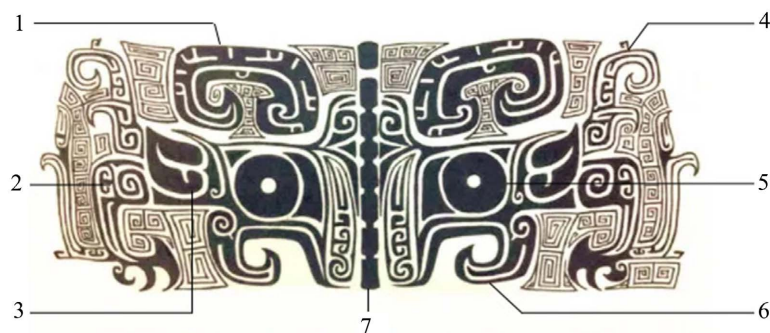
Figure 1. Beast face pattern (1. M-shaped sheep horn; 2. Foot; 3. Leaf shaped ear; 4. Tail; 5. Trochoid; 6. Tooth; 7. Nose) 图1. 兽面纹(1. M型羊角; 2. 足; 3. 叶形耳; 4. 尾; 5. 回字形目; 6. 牙; 7. 鼻) ①

兽面纹, 学界对其另一个称谓是饕餮纹, 现在我们在博物馆里见到的, 最有代表性的就是《吕氏春秋》中的“饕餮纹”。通常兽面纹是以动物的正面图像为主, 再加上躯干、翅膀、脚爪等部分, 见图1。在这些纹路中, 正面的头颅是最显眼的, 兽面纹中的头颅比躯干、翅膀、爪子都要大得多, 有些甚至看不清是否具有身体部分。以青铜器的中线来看, 它刻画的是兽面纹的鼻子, 整体来看眼睛是夸张的, 弱化兽爪和身躯, 更多的是将兽面的轮廓凸显出来。