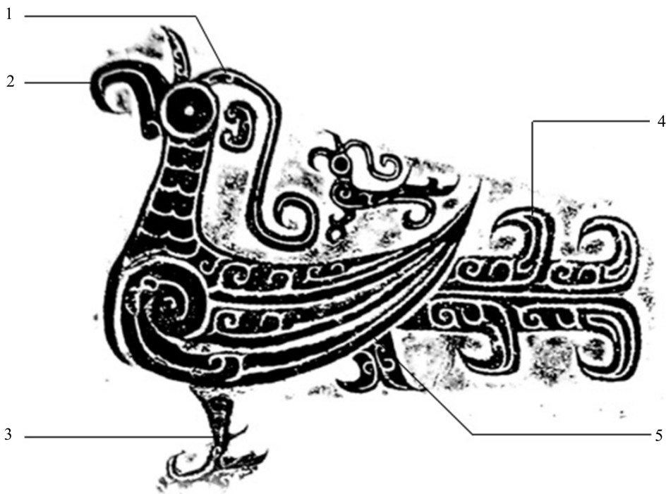
Figure 3. Phoenix pattern (1. Crown or horn; 2. Hook bill; 3. Foot; 4. Wing; 5. Body tail) 图3. 凤鸟纹(1. 冠或角; 2. 勾喙; 3. 足; 4. 翼翅; 5. 身尾) ®

和龙相比, 凤鸟纹是一种比较常见的装饰纹。凤鸟大都翅膀丰满, 体态优美, 往往仰头仰望, 见图3。以勾喙、羽翼最为突出, 勾喙为首要特征, 凤鸟纹有一部分没有明显羽翼。