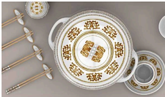
Figure 4. Animal face pattern on porcelain products 图 4. 兽面纹瓷盘 ④

龙纹在石刻制品上的应用, 将青铜器幻想动物纹饰中龙纹的面部元素提取出来, 采用二方连续的方法, 生成一个新的连续的纹样, 通过向上向下反复进行连续排列, 最后再以剪影的方式围合成一个圆柱雕刻在石制品上, 从而铸造成具有新型装饰纹样的石刻制品, 如图 5。