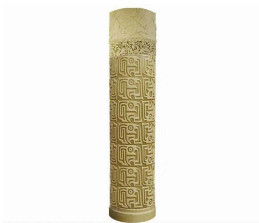
Figure 5. Roman stone column with dragon pattern 图 5. 龙纹罗马石柱 ④

龙纹在石刻制品上的应用, 将青铜器幻想动物纹饰中龙纹的面部元素提取出来, 采用二方连续的方法, 生成一个新的连续的纹样, 通过向上向下反复进行连续排列, 最后再以剪影的方式围合成一个圆柱雕刻在石制品上, 从而铸造成具有新型装饰纹样的石刻制品, 如图 5。