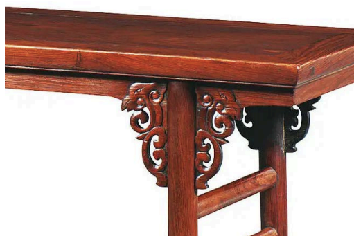
Figure 6. Phoenix pattern flat head case 图 6. 凤纹平头案 ④

凤鸟纹在现代家具艺术设计中的应用, 如图 6, 该凤纹平头案就是对青铜器幻想动物纹饰中的凤鸟纹进行提取、简化和再设计, 形成新的抽象凤纹。以新的凤鸟纹为主设计元素, 通过彩绘和雕刻的装饰手法将其呈现在新的铸造品上。