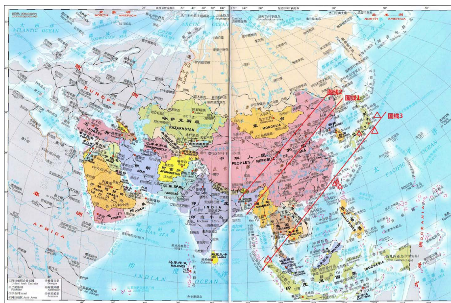
Figure 2. A schematic diagram of the 2H three parallel lines (line 1, line 2 and line 3) of the great earthquake in China 图 2. 中国大地震 2H 三平行线示意图