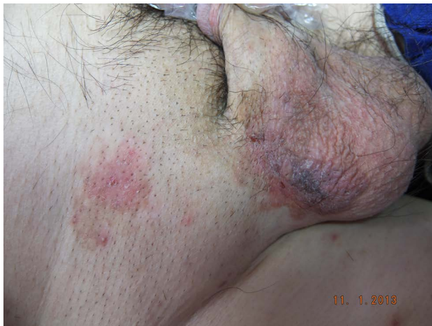
Figure 3. Clinical picture of case 2 图 3. 例 2 患者临床照片