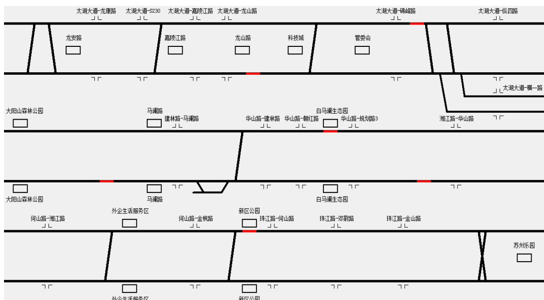
Figure 2. The line simulation of the tramcar of line one in the Gaoxin region

如表 2 所示, 为交叉口加入有轨电车优先控制方案的前后对比, 由表中可以看出, 加入控制方案后