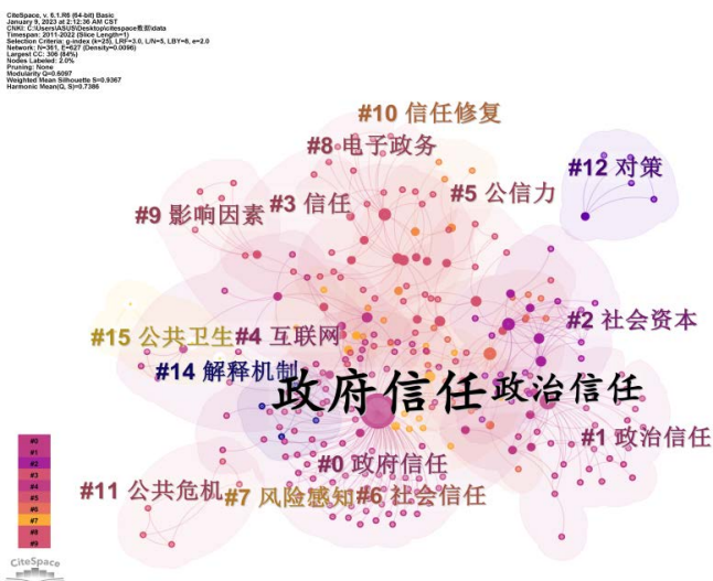
Figure 4. Keyword co-occurrence network 图 4. 关键词共现网络

热点三: 提升政府信任度是目前政府信任研究的核心任务, 而信任修复是政府信任危机、公共危机研究的主要策略和方法选择。从互联网、电子政务、对策、解释机制等关键词可以看出, 创新政府的治理方式、提升政府社会治理能力是进行信任修复的重要方法。而网络空间治理、“互联网+政务”等方式是创新政府治理方式的具体选择, 目前来看比较受到政府的重视。