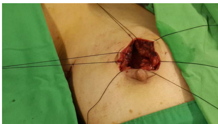
Figure 1. Surgical cavity after safety margin of tumor removal 图 1. 保留乳房手术, 肿瘤切除后之手术腔

其分析中, 术中放射线治疗其效果不亚于术后的全乳房放射治疗[6] [7], 尤其对于患者的病况属于较低局部复发风险(肿瘤荷尔蒙接受体阳性、HER-2 阴性者)。而本院于短期的追踪期间, 并无案例发生局部复发或是远程转移。