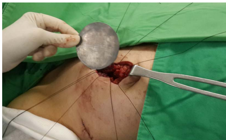
Figure 2. Placement of lead sheet into surgical cavity to protect internal organ